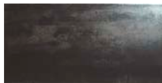
TITANIUM 3060 NEGRO | 30x60 cm | B28