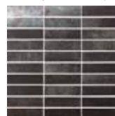
MOSAICO TITANIUM 30 NEGRO | 30x30 cm | P71