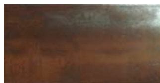
TITANIUM 3060 ÓXIDO | 30x60 cm | B28